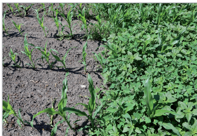
Ošetrená časť poľa prípravkom TUDOR 114 OD vs. neošetrená časť

Termín aplikácie: prípravok aplikujte po vzídení burín, vo fáze 2-8 listov kukurice (BBCH 12-18). Prípravok je najúčinnjší proti mladým, dynamicky rastúcim dvojkličnolistovým burinám vo fáze 2 až 4 listov (BBCH 12-14) a proti jednokličnolistovým burinám vo fáze 3 až 5 listov (BBCH 13-15).